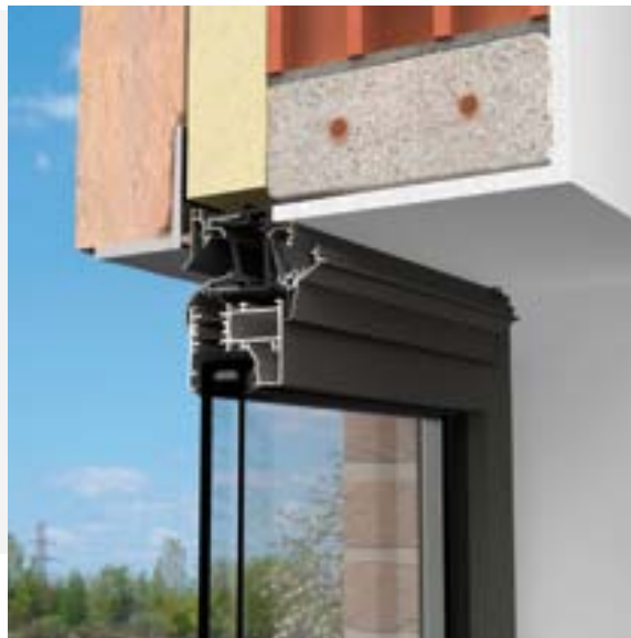
3D Invisivent® EVO - buiten

De luchtstroom wordt automatisch geregeld door een uit twee componenten bestaande zelfregelende klep, dewelke is bevestigd in de toevoeropening via een gepatenteerde trillingsvrije ophanging. De klep reageert automatisch op drukverschillen en windsterkte, kan niet beïnvloed worden door de gebruiker en is onderhoudsvrij. De luchtstroom kan ook manueel geregeld worden door middel van een aluminium binnenprofiel dat van een meerstandenregeling voorzien is. In open stand wordt de binnenkomende luchtstroom naar boven geleid om tocht te vermijden.