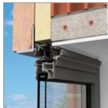
3D Invisivent® EVO HF - binnen

De Invisivent® EVO HF is een variant van de alomgekende Invisivent® EVO; s'werelds meest discrete, zelfregelende ventilatierooster. De Invisivent® EVO HF heeft een debiet dat 30% groter is dan de standaard Invisivent® EVO. Het rooster is daarom de ideale oplossing voor gebruik in kamers met kleine ramen waar toch een toereikend debiet wil bereikt worden. In gesloten positie is er geen visueel verschil tussen de Invisivent® EVO HF en de Invisivent® EVO.